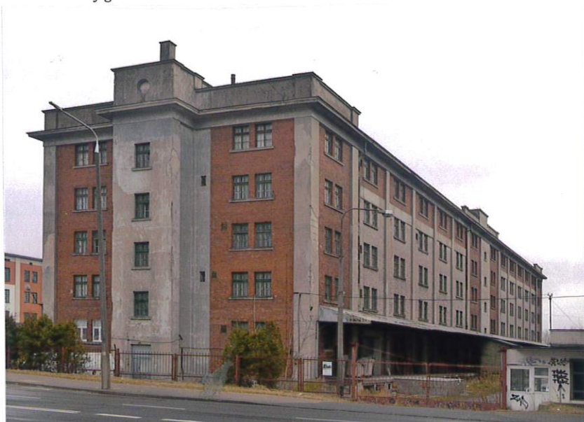
Fot. 1. Elewacja zachodnia (od ul. Wierzbickiej) i elewacja południowa z rampą przeładunkową (powyżej).